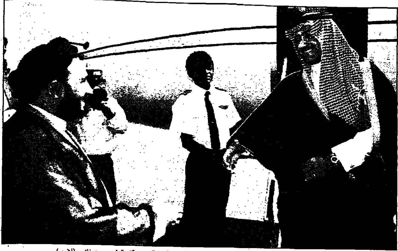
الامير تركي بن عبد الله بن عبد العزيز الذي وصله مطار طوران اسر حيث كان في استقباله مدير مكتب الرئيس محمد خاتمي

مقديشو - اف بى: دخلت ثلاثة من زعماء الحرب الصوماليين ادارة مشتركة لتولي شؤون مقديشو المحرومة من السلطة مركزية منذ ثمانية سنوات. وقد تكرر عدد من الصعالي في العاصمة الصومالية الاثني عشر على مهندي محمد وحسين محمد وعبد محمد كنياري الفرح عتيبا للمسؤول العسكري السابق حسن علي احمد حاكماً جديداً لمقديشو. واعان على مهندي محمد الذي يسيطر على شمال العاصمة الصومالية أنه باعيد فتح مطار ومرافق مقديشو. وأضاف على حال لم تعمل هذه الإدارة بالشكل المناسب لتلبية الشعب ان يرفضها وإذا ما تبين أنها مناسبة لسيدافع عنها. وكان زعيمان آخران هما عثمان حسن علي عاترو وموسى سويدي ويلاو احد مواطني علي مهندي قادراً الاجتماع مساء اسر الأول غير واضحين لرفضها هذا الاجراء. وشارك في رفضها عدد من الاجراء. وشارك في رفضها عدد من الاجراء. واعان على مهندي محمد أنه باعيد ديمراتي والفق عليه من مطم سكان مقديشو.